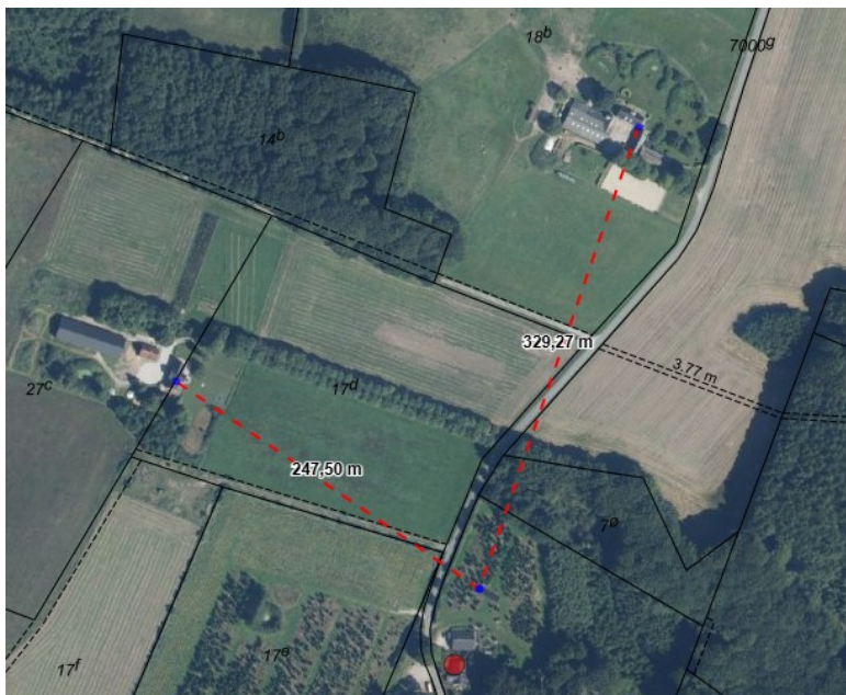
Kort med oplysning om afstande fra solcelleanlæg til naboer

Det er vurderet, at det ansøgte, ikke vil få væsentlig indvirkning på de omkringliggende ejendomme, da nærmeste nabobeboelser ligger mere end 250-300 meter væk.