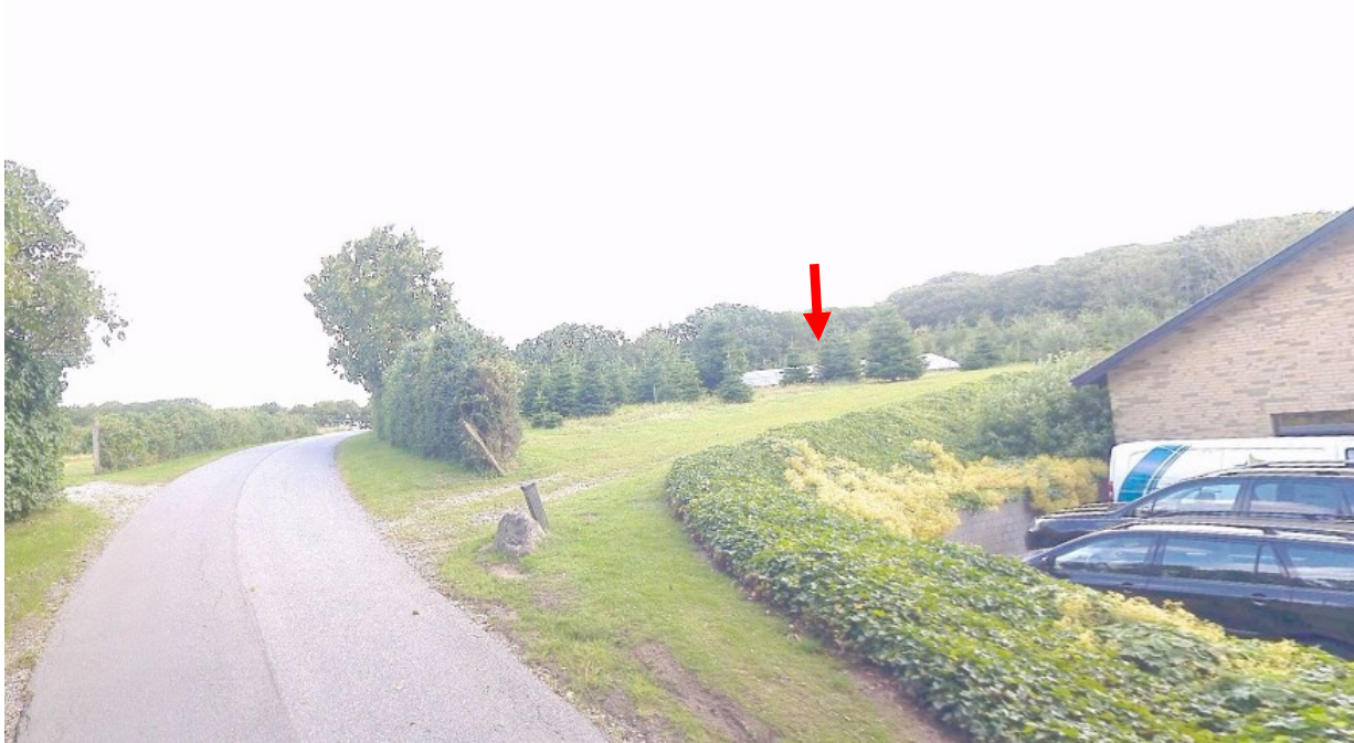
COWI gadefoto set fra vejen – anlægget ses bag træerne